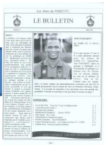
Avril 2001, parution du 1 er « Les amis du PFC »