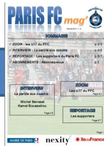
Février 2010, parution du 1 er « PFC Mag »