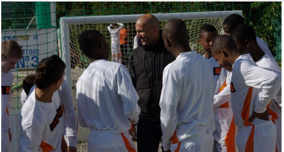
Les jeunes du PFC avec Z.Zidane